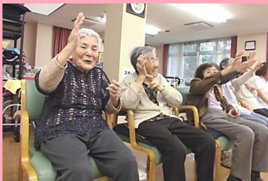
健康・リハビリ活動